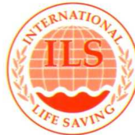
1 Colour Logo (Spot) Red Pantone 032