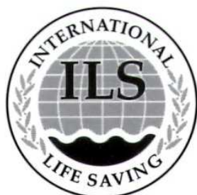
1 Colour Logo Black with Tint