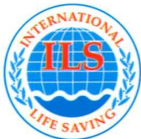
2 Colour Logo (Spot) Process Blue, Red Pantone 032