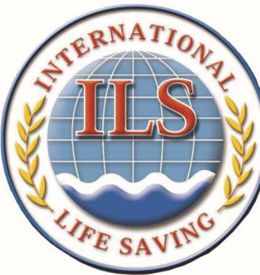
Logotipo en 3 D