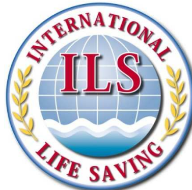
Logotipo en capas