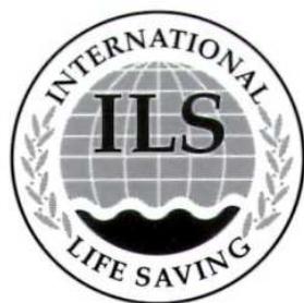
1 Colour Logo Black with Tint