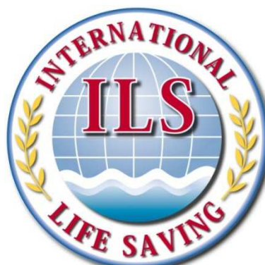
Logotipo en capas