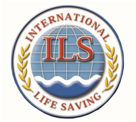
Logotipo en 3 D